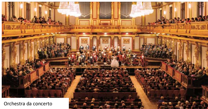
Orchestra da concerto